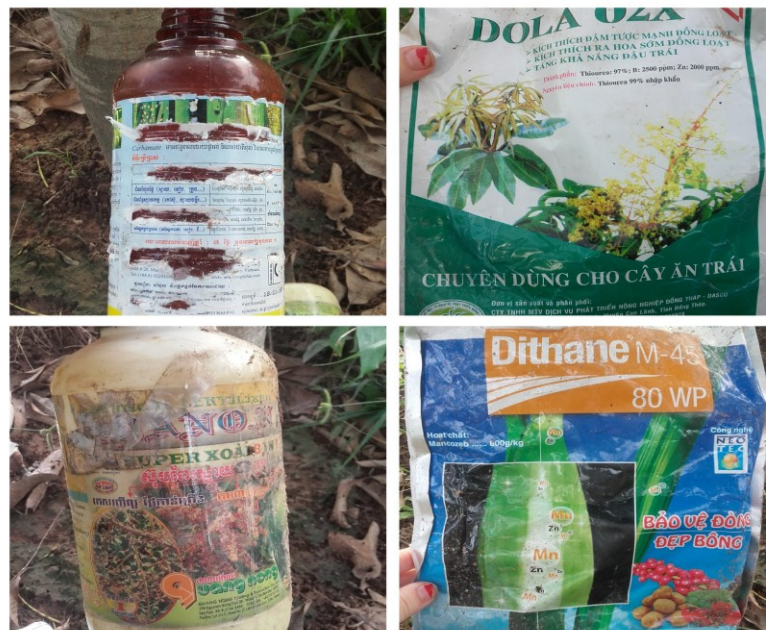
Obrázek 4: Chemikálie používané na mangových plantážích, Chambok, 3.10.2016