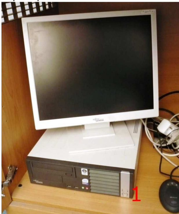
Obsah levé části úložného prostoru katedry (Obr. 1).

V druhé části skříně se nachází bezdrátová klávesnice, myš a zesilovač (Obr.2). Pro používání počítače, postavte myš a klávesnici na katedru.