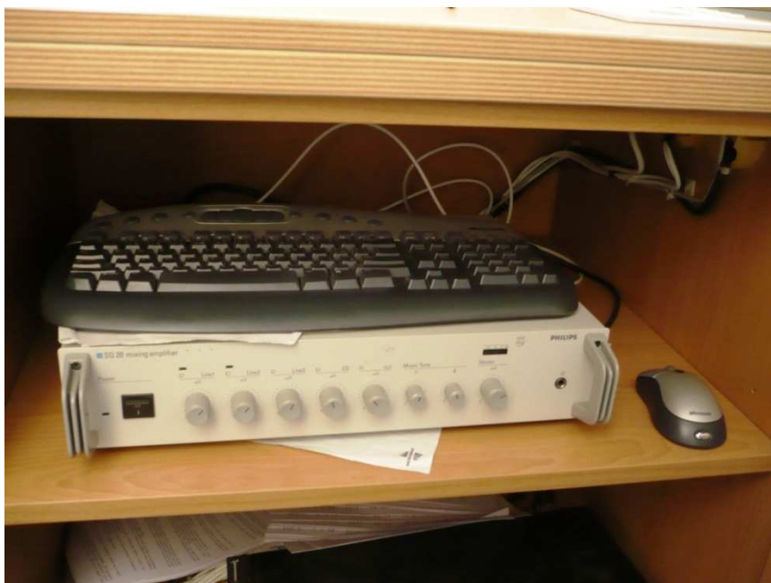
Obsah pravé části úložného prostoru katedry (Obr. 2).

V druhé části skříně se nachází bezdrátová klávesnice, myš a zesilovač (Obr.2). Pro používání počítače, postavte myš a klávesnici na katedru.